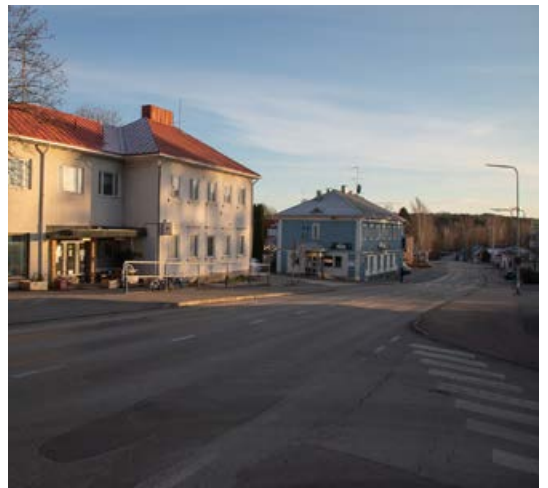
Onkkaalantie nähtynä Haanloukkaantien risteyksestä etelään päin.

Kaavoituksessa osallisia ovat suunnittelualan maanomistajat ja ne, joiden asumiseen, työntekoon tai muihin oloihin kaava saattaa huomattavasti vaikuttaa, sekä viranomaiset ja yhteisöt, joiden toimialaa suunnittelussa käsitellään.