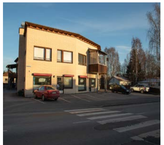
Kaavamuutosalueella korttelissa 117 sijaitseva asuin- ja liikerakennus..