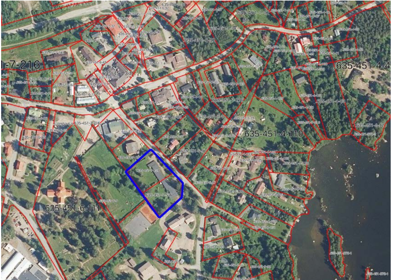
Suunnittelualueen sijainti ja rajaus. Suunnittelualue on rajattu sinisellä viivalla. Rajausta voidaan tarkistaa hankkeen aikana.

OSALLISTUMIS- JA ARVIOINTISUUNNITELMA 21.12.2021