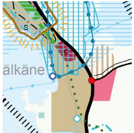
Ote Pirkanmaan maakuntakaava 2040:sta.

Tavoitteena on, että asemakaavan muu- tos mahdollistaa suunniteltujen yhteisö- talojen rakentamisen alueelle.