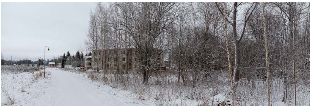
Suunnittelualue nähtynä Pälkäneenkujalta.

Kaavaprosessin vaiheista ja nähtävillä olosta tiedotetaan ilmoittamalla Sydän-Hämeen lehdessä ja kunnan internetsivuilla.