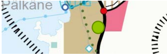
Maakuntakaavaote parhaillaan nähtävillä olevasta maakuntakaava 2040:sta; suunnittelualueen summittainen sijainti osoitettu oranssilla ympyrällä

Voimassa olevassa Pirkanmaan 1 maakuntakaavassa Lastenlinnan metsän suunnittelualueelle kohdistuu vain taajamatoimintojen aluemerkinä. Asemakaavoituksen suunnittelun aloittamisen aikoihin nähtävillä olevassa maakuntakaava 2040:n ehdotuksessa Lastenlinnan metsän suunnittelualue sijoittuu lisäksi taajamatoimintojen kehittämisvyöhykkeen sisälle.