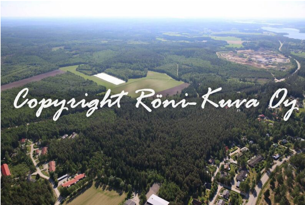
Lastenlinnan metsän asemakaavan suunnittelualue

Suunnittelualue on tällä hetkellä rakentamaton.