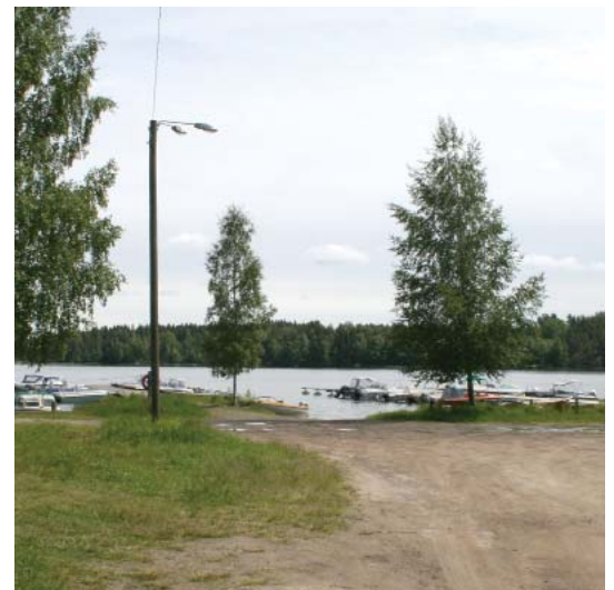
Venevalkama Alikyläntien päässä.

Kaavaprosessin vaiheista tiedotetaan ilmoittamalla lehdessä sekä kunnan ilmoitustaululla ja internetsivuilla.