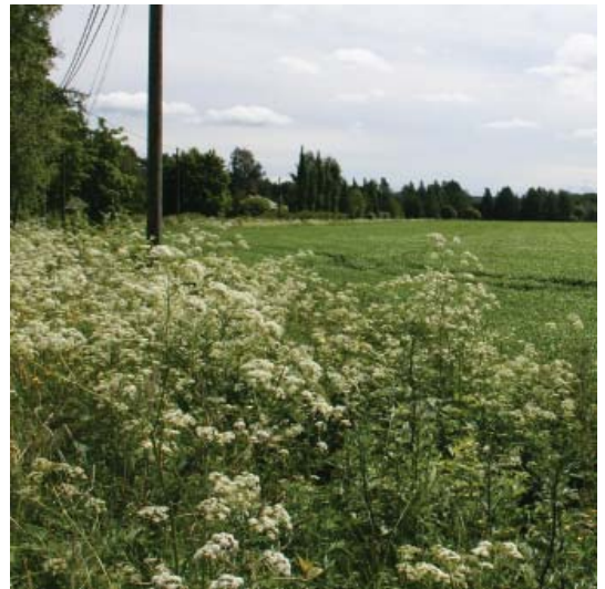
Pappilan länsipuolella oleva peltoalue.

Alueella ei ole voimassa olevaa asemakaavaa.