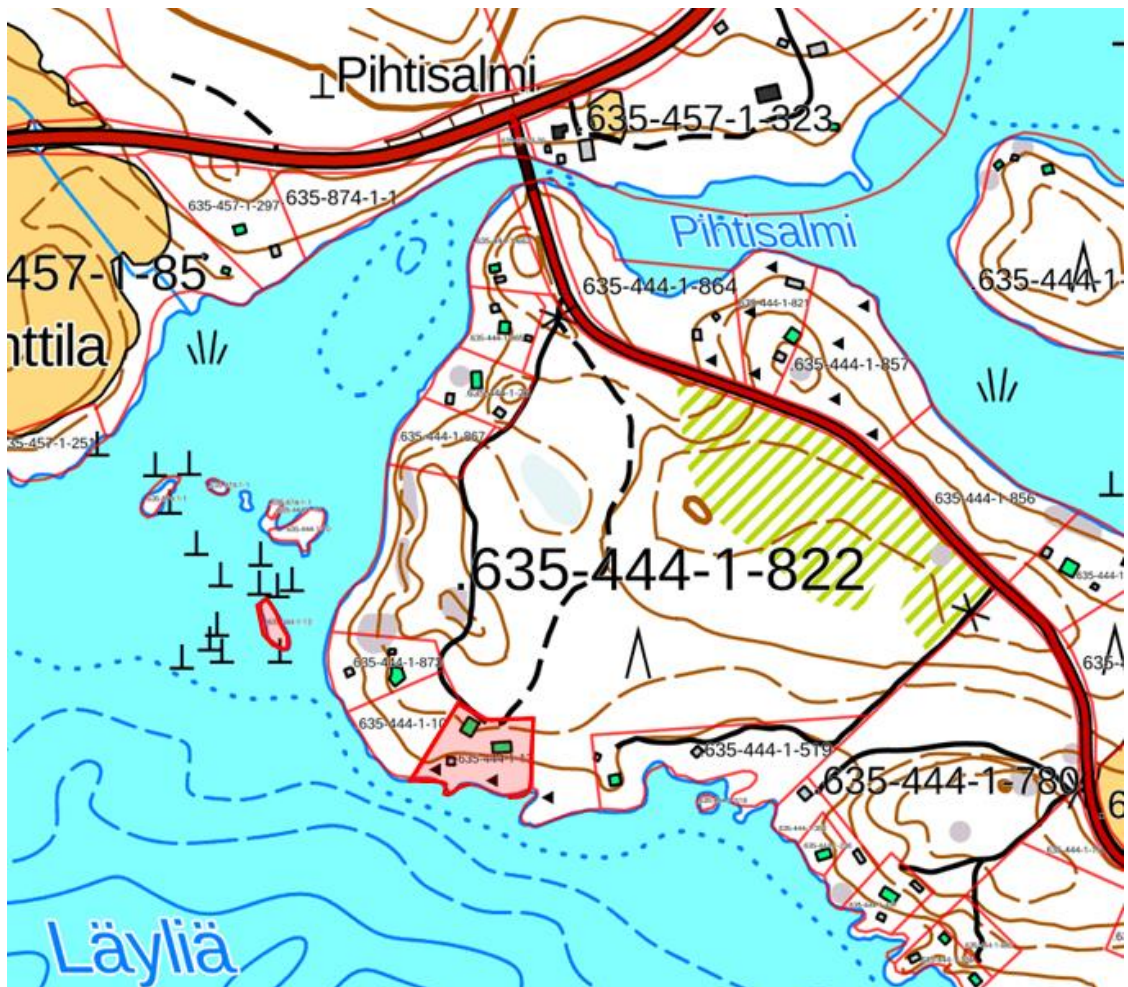
Kuva 2. Suunnittelualueen (tila Läyliänranta 635-444-1-13 alue) likimääräinen aluerajaus on esitetty punaisella.

Ranta-asemakaavan muutos laaditaan tilalle Läyliänranta 635-444-1-13. Suunnittelualueen pinta-ala on yhteensä 0,5533 ha ja siihen kuuluu 110 m mantereen rantaviivaa ja 110 m pienen saaren (0,058 ha) rantaviivaa. Kaavan muutosalue muodostuu jo rakentuneesta lomasantotontista ja metsäisestä saaresta (Kuva 2).