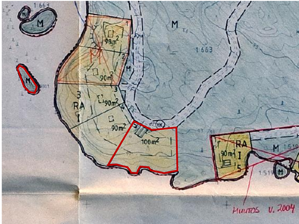
Kuva 4. Ote Pihtisalmen ranta-asetuksesta. Suunnittelualue on rajattu punaisella viivalla.

Suunnittelualueella on voimassa 10.6.1992 vahvistettu Pihtisalmen ranta-asetus. Pihtisalmen ranta-asetuksessa tilan Läyliänranta 635-444-1-13 mannerpalsta on osoitettu loma-asuntojen korttelin (RA) 3 tontiksi 5. Läyliänrannan tilaan kuuluva saari on osoitettu maa- ja metsätalousalueeksi (M) (Kuva 4).