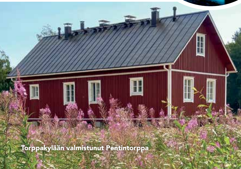
Torppakylään valmistunut Pentintorppa