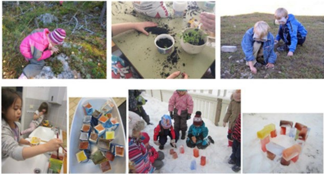
Tutkin ja toimin ympäristössäni

Tutkiva ja kokeileva oppiminen on keskeinen osa esiopetusta. Lapset harjoittelevat kysymysten esittämistä, havaintojen tekemistä ja niiden jäsentämistä. Heitä kannustetaan vertailemaan, luokittelemaan ja pohtimaan syy-seuraussuhteita. Pienet kokeet sekä havainnointi- ja dokumentointivälineiden käyttö tukevat lasten tiedon rakentumista.