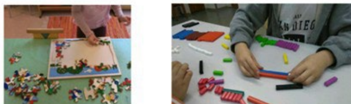
Tutkin ja toimin ympäristössäni