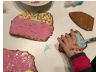
Kasvan ja kehityn

Pälkäneellä keskustellaan lasten kanssa kuluttamisen kulttuurista. Kierrätysmateriaalin sekä lahjoituksena saatujen lelujen ja pelien kautta huomaamme, että myös käytetty voi olla toiselle käyttökelpoista. Pälkäneellä kannustetaan pitämään oppimisympäristöstä välineineen hyvää huolta. Huolletaan ja korjataan tarpeen tullen myös yhdessä lasten kanssa.