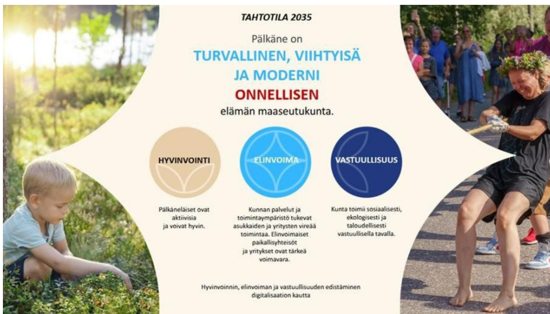
Pälkäne Parasta Aikaa 2035

Pälkäneen kunnassa on kuntastrategia 2035. Pälkäneen kunnan arvot ovat: avoimuus, yhteistyö ja vastuullisuus. Pälkäneen esiopetuksen arvot ovat yhdensuuntaiset kunnan arvojen kanssa.