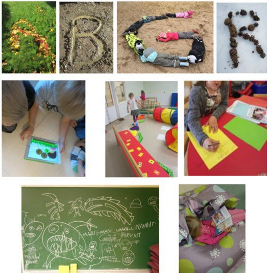
Kielten rikas maailma

Pälkäneellä lauletaan, leikitään, lorutellaan, tehdään omia tarinoita esimerkiksi sadutuksen keinoin. Esiopetuksen alkaessa tehdään alkukartoitus lapsen kielellisistä taidoista käytössä olevien materiaalien avulla. Tutkitaan ääniteitä, tavuja ja sanoja. Innostetaan lasta leikilliseen kirjoittamiseen sekä omien tekstien tuottamiseen. Lapset saavat kokemusta erilaisista tavoista tuottaa tekstiä leikillisesti tieto- ja viestintäteknologiaa hyödyntäen.