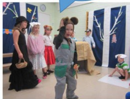
Ilmaisun monet muodot