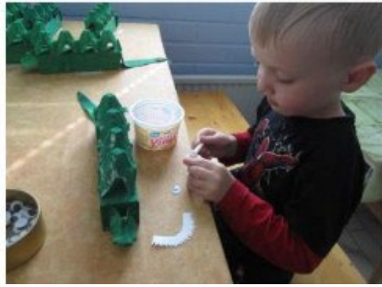
Ilmaisun monet muodot