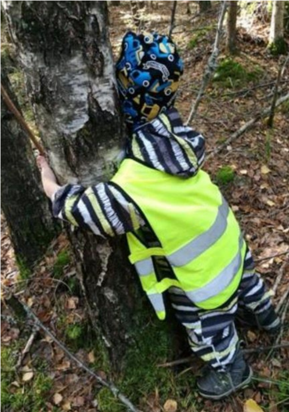
Metsä hoivaa ja rauhoittaa

Luonnossa toimimisen tueksi varhaiskasvatukselle laadittiin oma ympäristökasvatussuunnitelma vuoden 2023 aikana. Suunnitelmassa muun muassa esitellään lähiseudun retkikohteita, materiaalivinkkejä sekä vuosikello, jonka avulla voimme toiminnassa huomioida erilaisia teemapäiviä sekä -viikkoja. Suunnitelmassa huomioimme ympäristökasvatuksen ulottuvuudet; oppimisen ympäristöstä ja ympäristössä sekä toimimisen ympäristön puolesta.